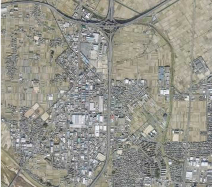
(空から見た久御山町)

久御山町では、「つながる心 みなぎる活力 京都南に『きらめく』まち ～夢いっぱい コンパクトタウン くみやま～」をまちの将来像に掲げ、「人の視点」、「環境の視点」、「協働の視点」に立ったまちづくりに取り組んでいます。