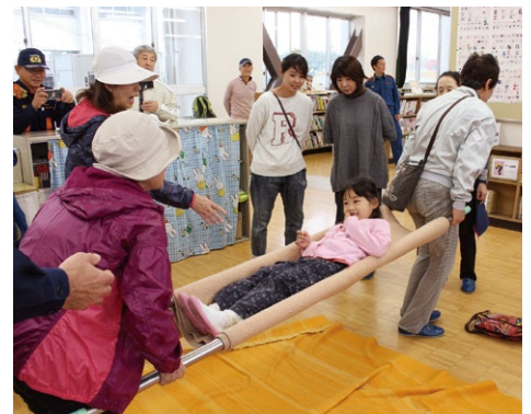
▲応急担架ののってみました