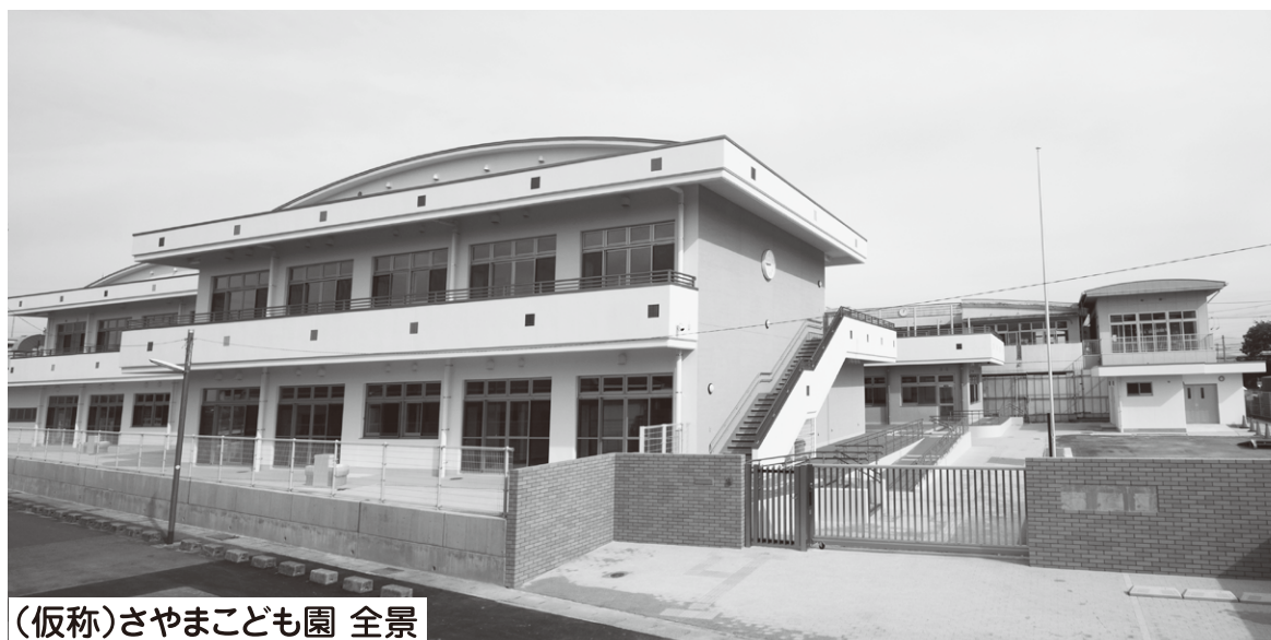
（仮称）さやまこども園 全景