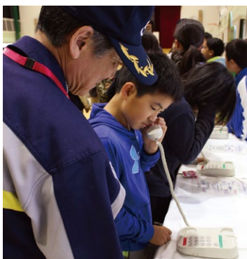
▲災害用電話の体験とダンボールの簡易ベッドの体験をする参加者▼