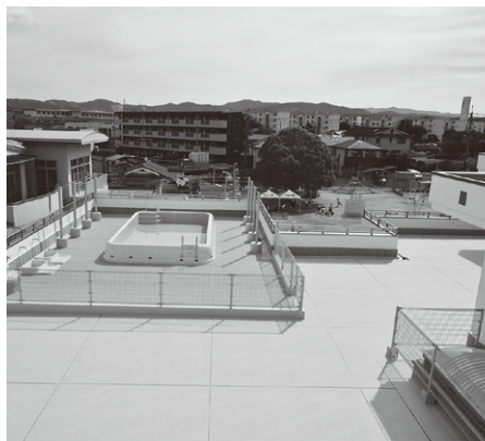
屋上プール・広場

A. こども園となっても、保育料の改定は予定していません。これまでもどおり、1号認定(幼稚園枠)と2号・3号認定(保育所枠)の保育料となります。また、延長保育料、預かり保育料についても、改定予定はありません。