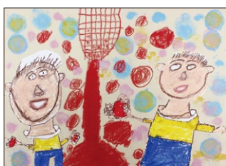
評 運動会の玉入れの様子を元氣いっぱい描けました。