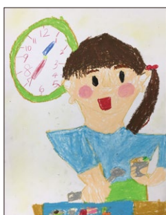
評 人物を大きくのびのびと描けました。とても嬉しそうでした。