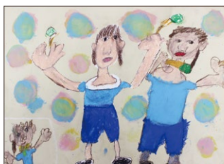
評 体や服をしっかりと塗り込み、元氣よく踊る姿を描けました。