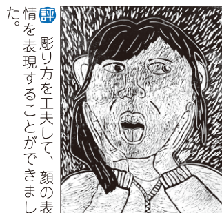
評 彫り方を工夫して、顔の表情を表現することができました。