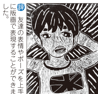
評 友達表情やポーズを上手に版画で表現することができました。