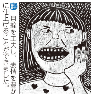
評 目線を工夫し、表情を豊かに仕上げる事ができました。