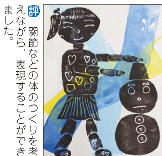
評 関節などの体のつくりを考えながら、表現することができました。