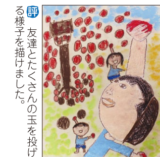
評 友達とたくさん玉を投げる様子を描けました。