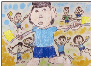
評 友達と楽しく踊っている様子を描くことができました。