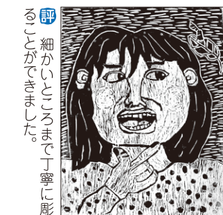
評 細かいところまで丁寧に彫ることができました。