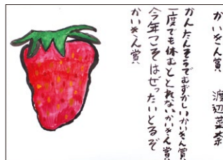
5年 渡辺 菜奈(林)