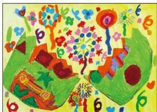
2年 宇山 紗葉(米)