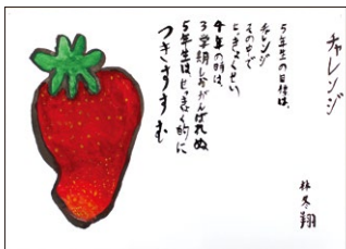
5年 林 冬翔(米)