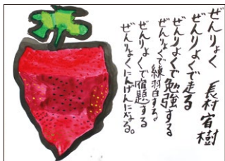
5年 長村 青樹(米)