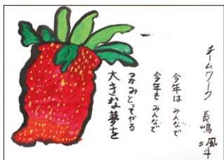
5年 長嶋 颯斗(米)