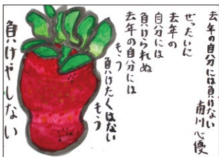
5年 南川 心優(林)