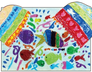
2年 入江 優衣香(米)