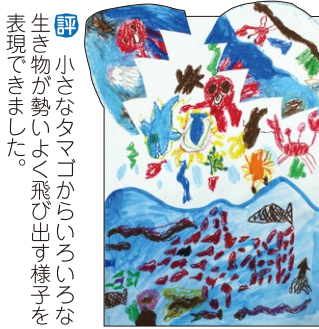
2年 中林 璃斗(林)