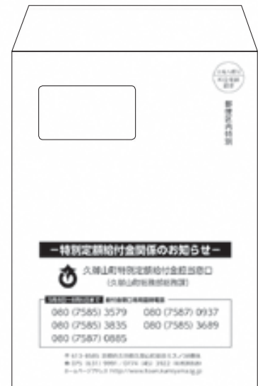
※申請書を入れた封筒のイメージ