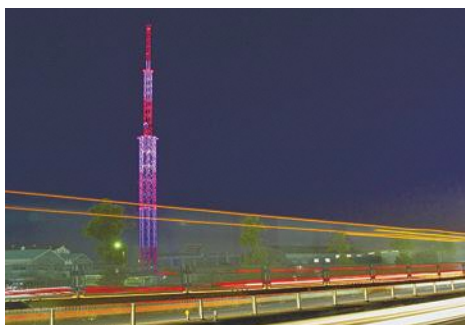
▲2020年度版町民カレンダー表紙