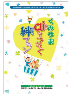
▲第2期地域福祉計画及び第3期地域福祉活動計画