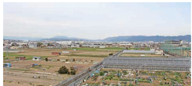
▲ゆうホールから見た新市街地(みなくるタウン)整備地区

※上記事業費は、一般会計・特別会計・企業会計のうち、人件費や一般事務費などを除いた実施計画事務事業の事業費です。