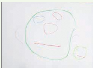
2歳児 尾野 心音 (田井)