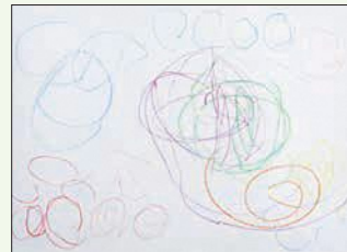
2歳児 田口 一花 (林)