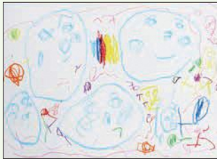
3歳児 林 杏奈 (藤和田)