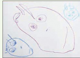
3歳児 廣瀬 朝陽 (佐山)