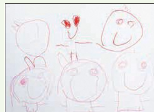
3歳児 藤原 優希 (佐山)