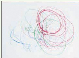
2歳児 岩本 芹奈 (佐山)