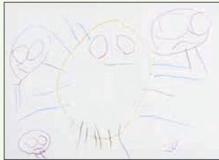
3歳児 福本 灯梨 (市田)