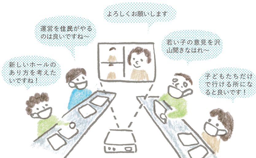
検討委員会は建物の専門家、町民協働の専門家、町内で活動されている子育てや福祉関係の方など様々な立場の方12名で構成されています。

まちづくりセンターを整備していく上での委員それぞれの思いを伝えあいました。コロナウイルス感染拡大防止を考慮し、リモートでの参加を取り入れ、密を避けた形の委員会となりました。