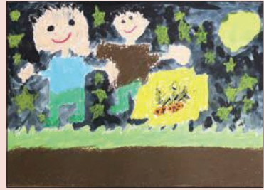
1年 やまもと けんた 山本 健太 (栄)