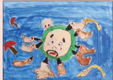
2年 まえだ りくと 前田 陸翔 (林)

評 たくさんのカモに引っ張られて、驚いているごんべえの表情を描くことができました。背景も考えて塗ることができました。