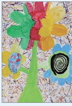
4年 木村 龍聖 (林)

【評】このまぼろしの花には「サッカーボールを飛ばす能力」があります。絵の具をつけたビーズを転がし、その模様を切り貼した背景がとても印象的です。