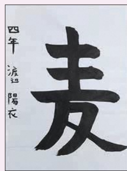
4年 わたなべ あおい 渡辺 陽衣 (佐山)