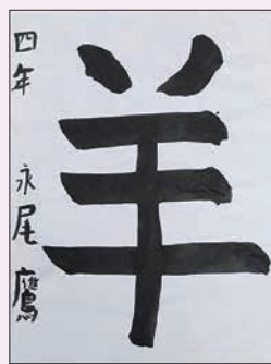
4年 ながお 永尾 鷹 (佐山)

評 始筆から終筆まで線の形を意識しながら、半紙の中心に堂々と書くことができました。