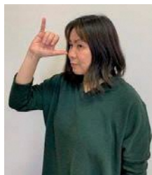
立てた親指側を鼻におきます。