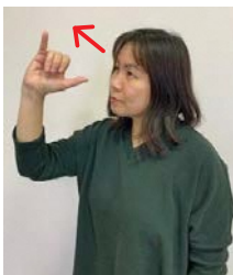
そのまま上方斜めに上げます。