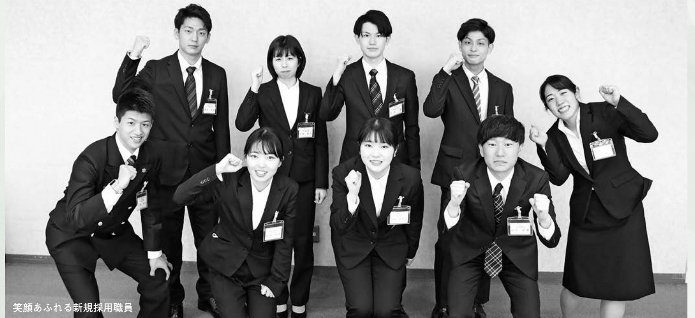
笑顔あふれる新規採用職員

4月1日付で発令しました。( )は異動前です。兼職発令や所属が変わらない主査級への昇任は除いています。