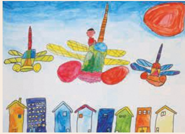
3年 いまし りん (林) 今西 琳音 (林)

評 トンボに乗って町を見下ろす自分の様子をしっかりと描けました。トンボの色彩にこだわり、工夫して色を塗りました。眼下に広がる町並みとトンボの距離を意識しました。