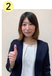
2 続けて親指(男性)を立てて胸前に置く。