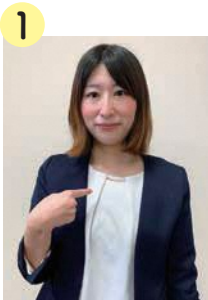
1 自分を指し、自分の夫であることを先に示す。

※他人の「夫」を表す場合は表現が変わります。その場合は、先に小指(女性)と親指(男性)を付け合わせ軽く胸の前に置き、親指側を少し斜め前に出します。