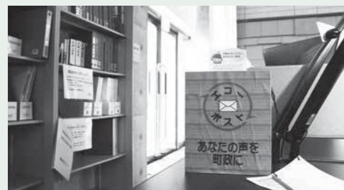
役場 1 階情報公開コーナー設置のエコーポスト