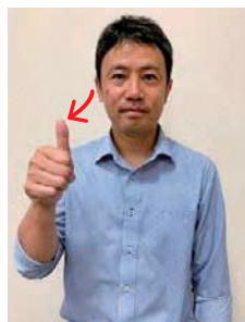
続けて、親指を立てて前に出す。