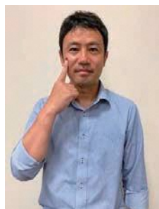
右手の人差し指で軽く頬を触る。