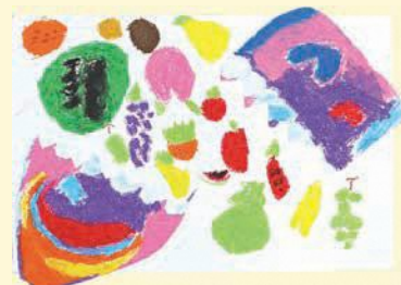
2年 なるかみ らら 鳴神 詩々 (下津屋)

評 かわいらしいたまごから、たくさんのくだものが生まれました。パスを使って丁寧に色を塗り、はっきりと描くことができました。