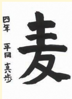
4年 ひらおか まはる 平岡 真歩 (田井)