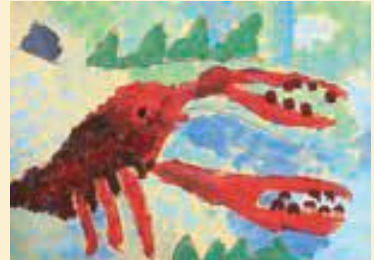
2年 苑樹 悠翔 (栄)

評 ザリガニを斜めから立体的にとらえて描きあげました。はさみの迫力が上手に表現できています。