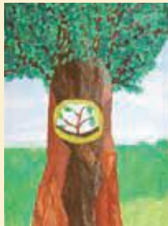
5年 宮坂 科宣 (林)

評 力強い幹とそこから伸びる枝、そして枝の周りに広がる葉っぱがダイナミックです。木の中の新芽で生命のつながりを表現しています。