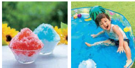
※KUMIDAN 久御山中央公園を楽しく活用するために集まった住民主体の運営組織