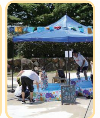
▲ステージ中央の水遊びスペース

※KUMIDAN 久御山中央公園を楽しく活用するために集まった住民主体の運営組織