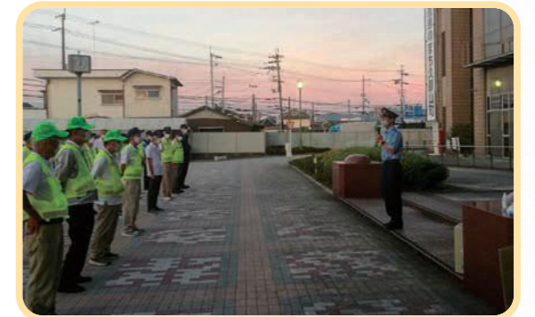
▲パトロール実施前の出発式の様子

8月2日、宇治・久御山防犯推進委員連絡協議会林ブロックと同協議会田井ブロック、宇治警察署、久御山町の4機関が合同で青色防犯パトロールを実施しました。全国的に子どもや高齢者が被害者となる事故や事件が発生している中、町民の安心・安全を守るために実施。パトロールは午後7時から町内全域を巡回し、防犯への協力を呼びかけました。