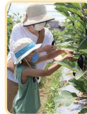
▲ナスを収穫する参加者