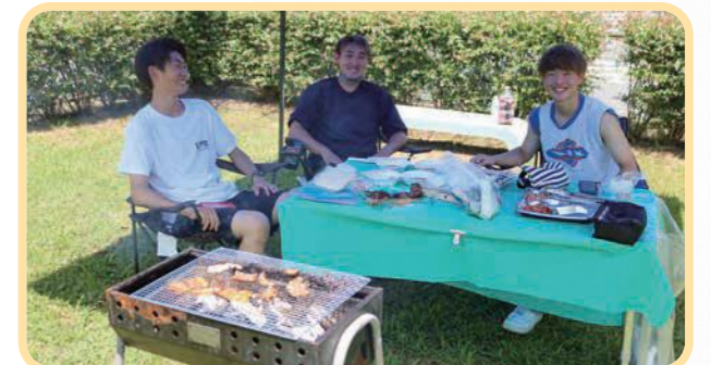
▲バーベキューを楽しむ若者たち

夏広場と同時に町内2か所の農園を巡る久御山野菜の収穫体験も開催し、普段入ることができない農園で農家さんの話を聞きながら、万願寺トウガラシや希少なナスなど沢山の野菜を収穫しました。収穫とは別にホワイトコーンや賀茂ナスのプレゼントもあり、大満足の収穫体験となりました。