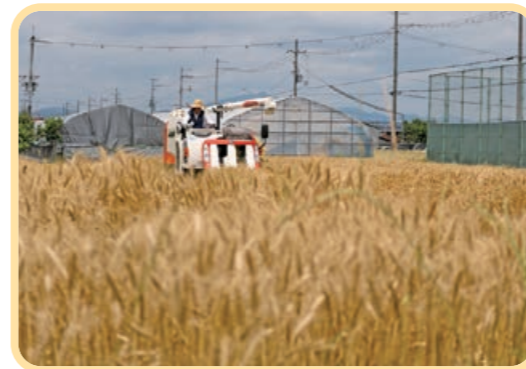
▲収穫は1週間ほどかけて行われました

6月2日、佐古麦生産組合が久御山高校周辺の約4.5㌥で共同栽培をしている麦の収穫が始まり、コンバインの音が周囲に響き渡りました。約30年ほど前から休耕田を活用し、麦栽培をしています。5年前からグルテンが豊富で製パン性に優れた「せときらら」に品種を変更。今年は、雑草が生い茂る所もあり、昨年より収穫が少し減りました。