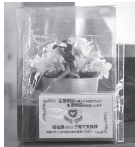
▲引換え券(1階総合受付にあります)