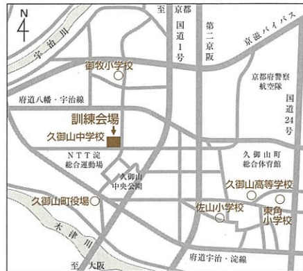
▲会場、避難場所案内図

佐山・御牧・東角小学校、久御山高校、久御山町役場から会場へ。バスの出発時間は、いずれも午前8時45分です。