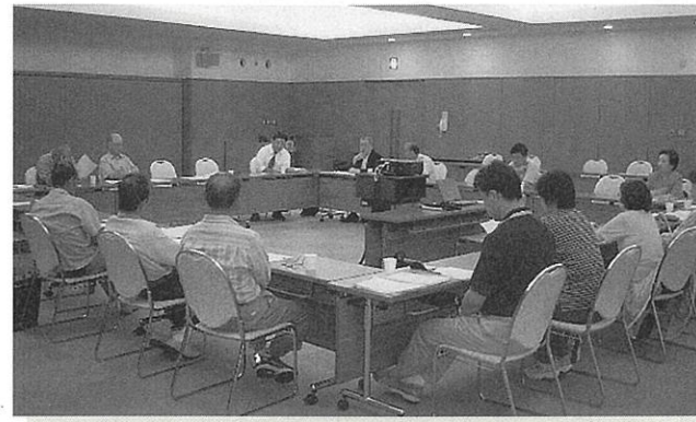
▲熱心に議論する会員

バスを育てる会は、広報紙などで呼びかけ、住民有志が今年3月から設立に向けて趣意書などを議論され、準備をされてきたものです。 今後は、会の存在や活動内容をさらに広め、現在25人の会員を増やしていくことが必要と考え、11月上旬に記念イベントの開催を予定しています。 町としては、会の運営に協力し支援していきたいと考えていますので、会員になりたい人やバスを活かしたまちづくりなどに関心のある人はお問い合わせください。 問い合わせ バスを育てる会事務局(都市計画課内)