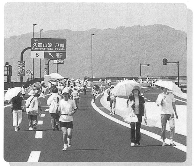
▲ハイウェイ・フリーウォーキング (8月6日)