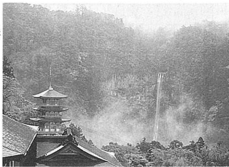
▲青岸渡寺(三重塔と那智の滝)

陀洛山寺がある。順拝日記には、「大海より大きに浪あたる成り、此所をきし打つ浪ト申し候」と、浜ノ宮海岸に打ち寄せる波の様子を、遙か彼方にあるという観音浄土(補陀落浄土)を心に描いて記したのであるうか。 東一口村の一行は、午の刻(正午)過ぎに第一番札所の青岸渡寺に参拝した。杉の巨木が並ぶ参道の、苔むした石段を登ると、正面に高さ一三三メートルの那智の大滝がある。岩に触れ飛沫する大瀑布に霊気が充滿し、心身ともに洗われるようである。 青岸渡寺の開創は古く、寺伝などによれば、四世紀、インドから熊野に漂着した裸形上人が那智の滝で修業中、黄金の観音像を感得