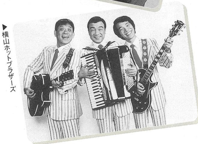
▲横山ホットブラザーズ